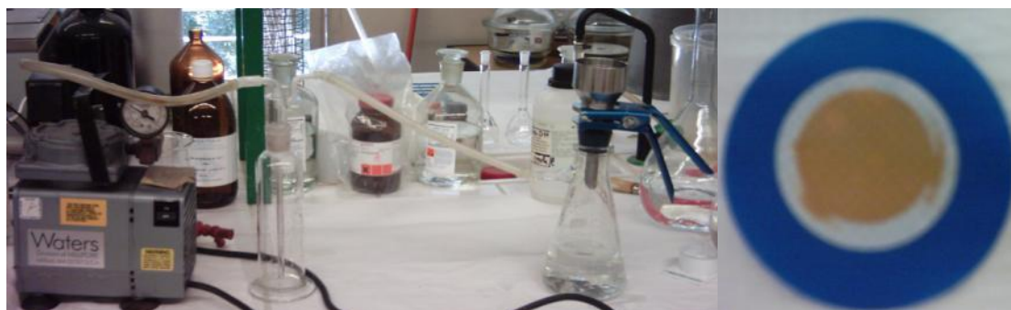
Figura 3. Processo de filtração prévia e aspecto final do filtro utilizado

A água utilizada nos ensaios laboratoriais estava contaminada por arsénio e foi recolhida, numa captação subterrânea localizada na freguesia de Arões, concelho de Fafe, pertencente à empresa Águas do Ave, S.A. , antes de ser submetida a qualquer tratamento. Ao longo de todo o trabalho de investigação foi necessário proceder a três recolhas de água bruta, cujas características (relevantes para este trabalho) estão sintetizadas no Quadro 3.