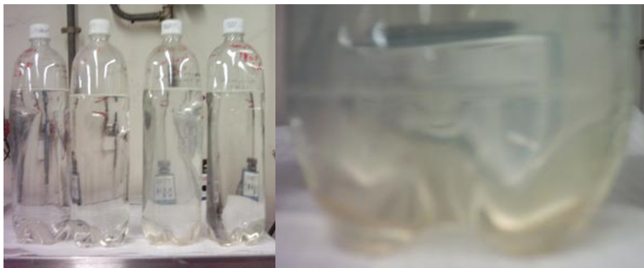
Figura 5. Ensaio de oxidação solar e pormenor do resíduo retido após um ensaio