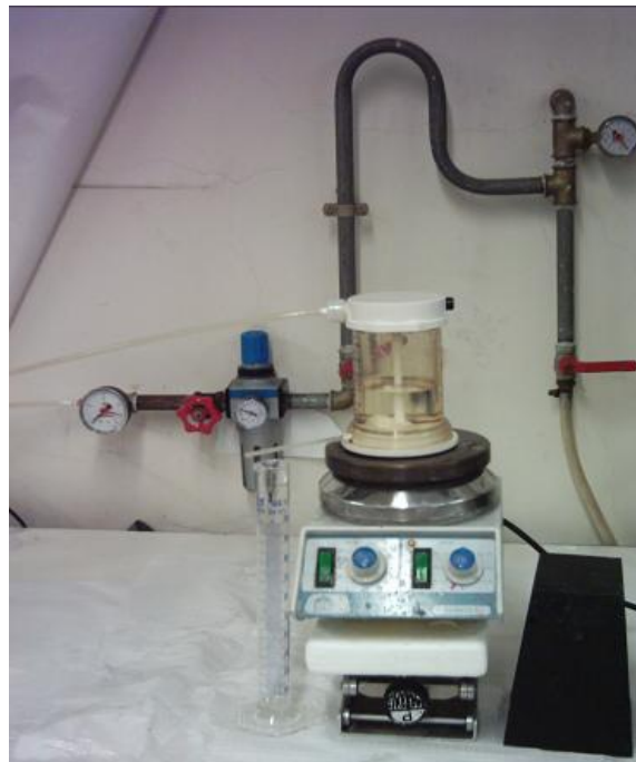
Figura 2. Instalação laboratorial utilizada no processo de separação por membranas

Na célula foram introduzidas três tipos de membranas de polietersulfona: uma de microfiltração (PAN/PVC 30) e duas de ultrafiltração (PM 10 e PM 30). Para remover materiais e/ou possíveis substâncias que possam encontrar-se na superfície ou no interior dos poros da membrana e para a determinação da respectiva permeabilidade hidráulica procedeu-se á indispensável lavagem inicial dos filtros. Todos os ensaios laboratoriais foram realizados mantendo as mesmas condições de operação e adoptando os mesmos procedimentos. As amostras guardadas para posterior análise foram sujeitas à leitura do valor do pH e da condutividade. Caso de as condições de ensaio fossem alteradas, as membranas passavam a ser sujeitas a uma lavagem química, à temperatura ambiente.