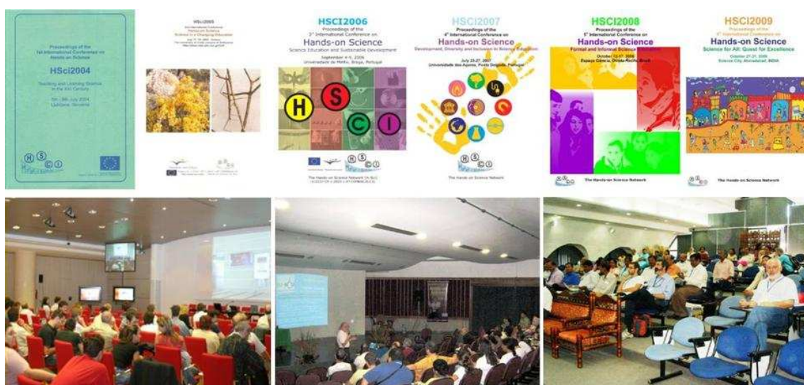
Figura 3.- Congresos HSci: Ljubljana/Eslovenia (2004); Rethimo/Grecia (2005); Braga/Portugal (2006); Azores/Portugal (2007); Recife/Brasil (2008); Ahmenabad/India (2009).

Al abrigo de la red HSci se estableció un grupo de trabajo para coordinar una campaña de relaciones públicas centrada en la enseñanza de la Ciencia. Está dirigido a profesores y educadores, centros de enseñanza y comunidad, Ministerios de Educación y Consejos Educativos, en un intento sistemático por demostrar los beneficios de un empleo generalizado del aprendizaje manipulativo de la Ciencia. Se realizaron dominios web interactivos, herramientas de simulación virtual y laboratorios en-línea de acceso libre. Se diseñaron módulos educativos experimentales y material de apoyo de diferentes niveles de complejidad. Se produjeron y se difundieron libros de texto e informes, incluyendo versiones electrónicas interactivas, en diversos idiomas.