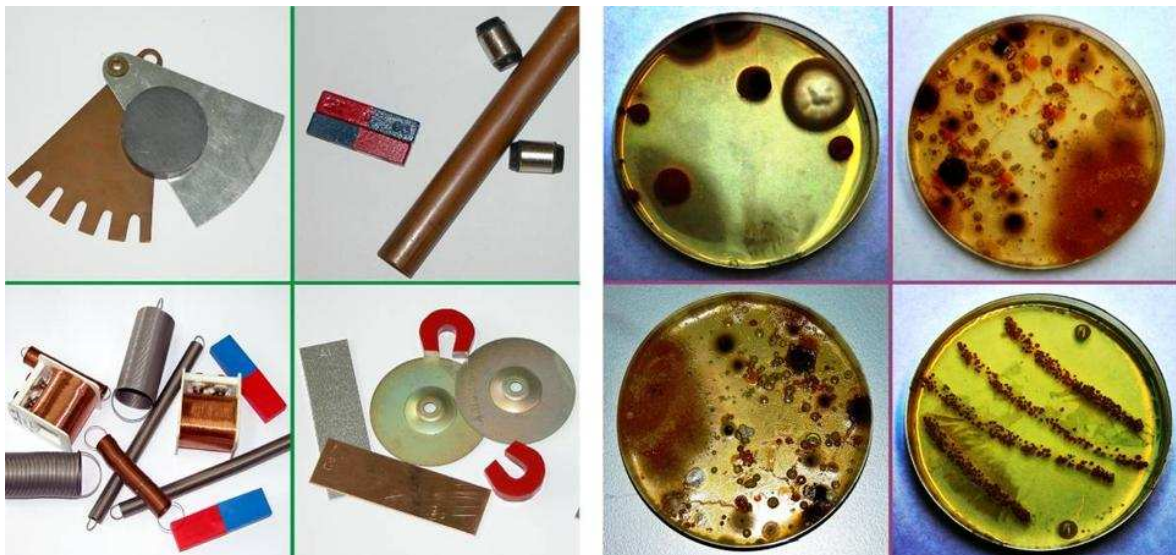
Figura 2.- Ejemplos de actividades manipulativas: inducción electromagnética (izquierda); microbiota normal (derecha).

Los miembros de la red tienen experiencia previa en la exploración y/o desarrollo de prácticas educativas innovadoras, y muchos de ellos participaron en proyectos pedagógicos nacionales o internacionales. Varios de los miembros tienen al mismo tiempo experiencia en la Enseñanza a Distancia y cuentan ya con sistemas adaptados al contexto TIC, algunos financiados por proyectos de la UE, e incluso hay miembros que participan en el diseño curricular en colaboración con sus respectivos Ministerios de Educación, Ciencia y Cultura.