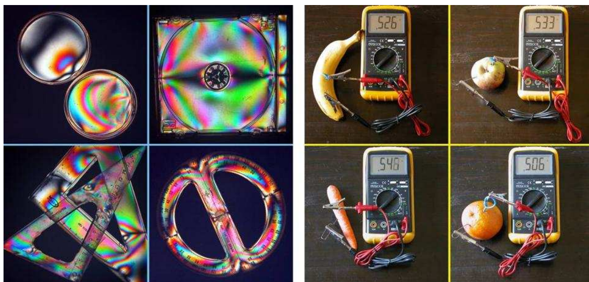
Figura 1.- Ejemplos de actividades manipulativas: birrefringencia y polarización (izquierda); batería electroquímica (derecha).

En nuestro conocimiento era la primera vez que una red tan amplia se formaba en la UE centrada en la difusión en la enseñanza científico-tecnológica de las actividades manipulativas. En este trabajo presentamos las principales propuestas pedagógicas, objetivos y estrategias y resultados de la red.