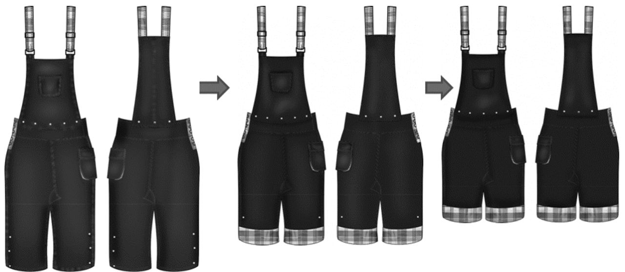
Figura 02: Simulación de desdoblamiento y lavado de la prenda piloto