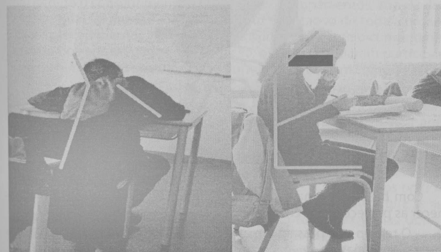
Figura 1 - Más posturas adotadas em sala de aula

A ergonomia, no caso escolar, tem como motivo o estudo da relação entre o mobiliário escolar e a postura mantida pelos alunos durante as aulas tendo em conta as sequelas advindas do uso do primeiro (BARROSO e COSTA, 2003; MORO, 2005; BARBOSA, 2009). Existe naturalmente a ideia generalizada de que é importante estar “bem sentado”, o que é fundamental porquanto as crianças passam muito tempo a executar tarefas em cima da mesa – escrever, ler, desenhar, recortar... Precisam, pois, de estar cómodas e sentadas de modo a concentrarem-se nessas tarefas e a não causar perturbações de postura. Assim, as cadeiras devem permitir um bom apoio dos pés, evitando demasiada pressão sobre a coxa ou sobre a região lombar (MORO, 1994). Também a mesa deve permitir que a criança, quando sentada, tenha os ombros relaxados e os antebraços apoiados (MORO, 2005; BARBOSA, 2009). Isso implica que a mesa não seja demasiado alta, para evitar que a criança “se pendure”, nem demasiado baixa, para que a criança não tenha de se curvar (Figura 1).