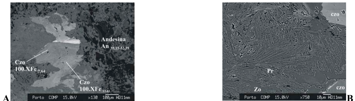
Fig. 2 – Discriminação dos intercrescimentos observados entre os minerais dos veios terminais ( \pi 3 ). A - cristal grosseiro subédrico de clinozoisite (Czo) com aspectos de corrosão. B – intercrescimento simplitítico entre zoizite (Zo) e agregados de prenite (Pr) prismática. XFe = Fe^{3+}/(Fe^{3+}+Al) (Deer et al., 1986).