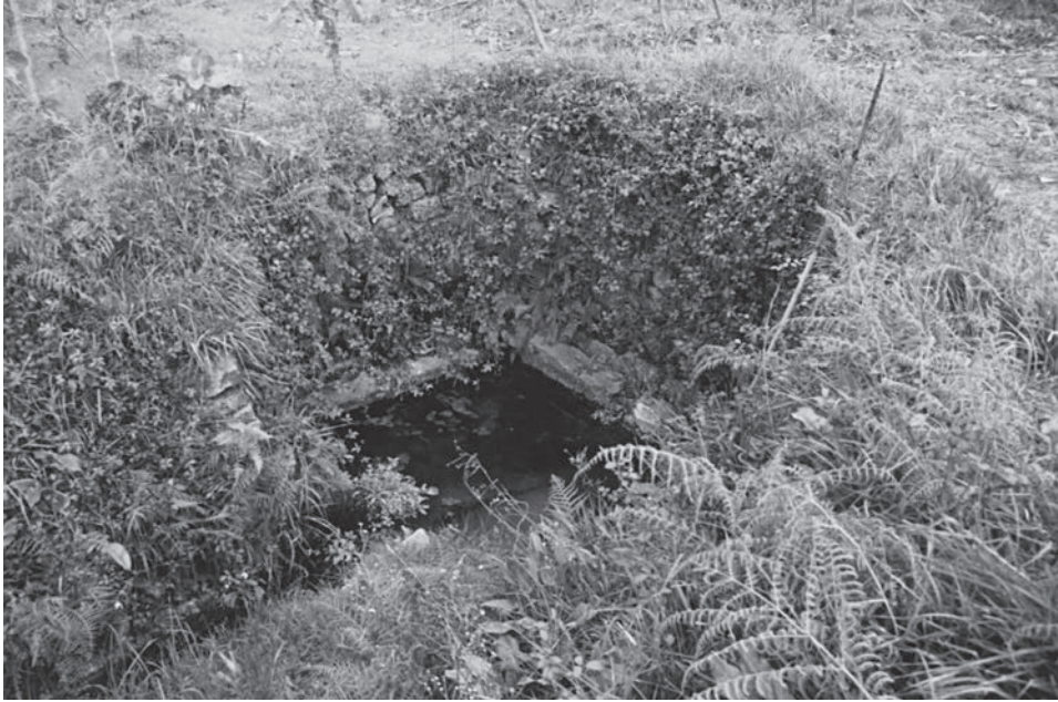
FIG. 6. Archa petrina .

si giustifica con il fatto che sono passati a costituire elementi di delimitazione dello spazio di Dume. La trasformazione della villa romana di Dume, la cui fondazione risale agli inizi del I sec. d.C., in una chiesa monastica, sede di una diocesi, attivò la cristallizzazione di alcuni elementi di demarcazione del territorio anteriormente centuriato. Il modo in cui tale processo avvenne viene studiato, in questo momento, ricorrendo, fra altri materiali, allo studio di un'operazione di agrimensura degli antichi confini della diocesi di Dume, risalente al 911 (FONTES et alii c.s.). 1 Il circuito allora percorso dagli agrimensori per delimitarlo utilizza vari elementi di demarcazione ( archas, petras fictas, terra tumeda ), alcuni dei quali forse riutilizzano elementi più antichi, legati alla centuriazione. 2