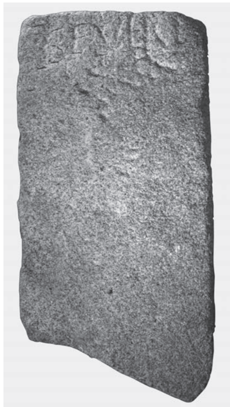
FIG. 8. Confine di proprietà (Museo Pio XII, Braga).

A partire dall'XI sec. è possibile prospettare, in modo ancora molto tenue, la rete di proprietà e la parcellazione attorno a Braga. La restaurazione della diocesi di Braga, nel 1071, fece scattare da parte delle autorità ecclesiastiche una sistematica appropriazione dello spazio agricolo della città.