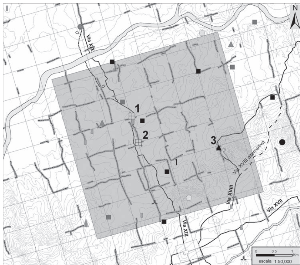
FIG. 3. Marcatore del paesaggio centuriato (1 e 2: cippi; 3: archa petrina ).

Designamo come ‘Cippo 1 - Felgueira’ un monumento che serve attualmente da confine fra due frazioni e che abbiamo rinvenuto nel corso di prospezioni realizzate nel 2004 (FIG. 3, nr. 1). Si tratta di un monumento di granito, con estremità superiore perfettamente levigata e due linee ortogonali. Il sondaggio archeologico realizzato nel 2008 ha portato in luce un monumento di 1 m d'altezza per 40/50 cm di larghezza massima, senza resti dello zoccolo (FIGG. 4.1. e 4.2.). Designamo come ‘Cippo 2 - Pinhel’ un monumento identico che delimita, attualmente, tre frazioni (FIG. 3, nr. 2). Seppure in peggior stato di conservazione rispetto al precedente, possiede l'estremità superiore levigata e due linee incise. Si tratta di un monumento di granito, ancora non oggetto di scavo, con 47 cm di altezza massima e 28 cm di larghezza massima (FIG. 5).