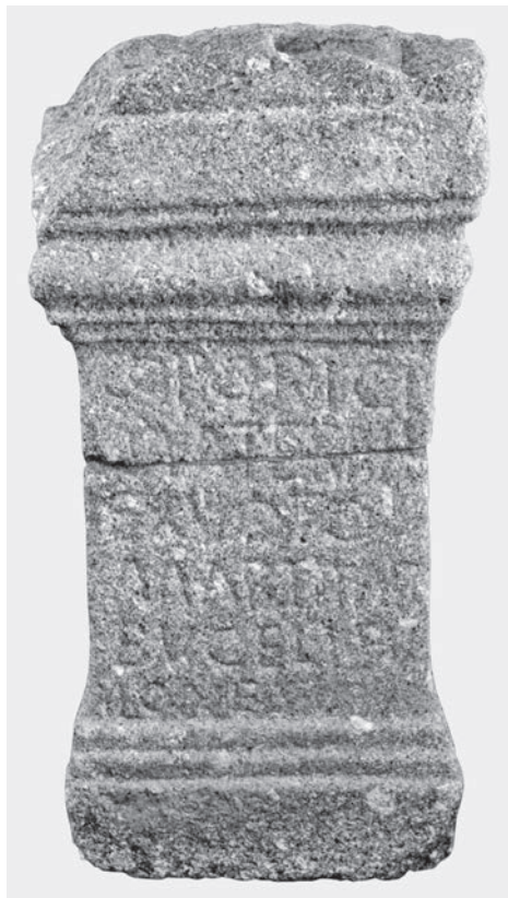
FIG. 7. Ara votiva dedicata a Marte (Museo Pio XII, Braga).