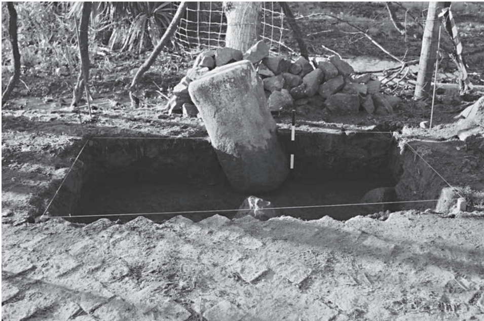
FIG. 4.2. Cippo 1-Felgueira (2008).