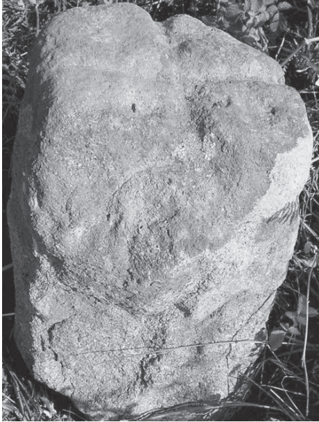
FIG. 5. Cippo 2- Pinhel (2004).

vado e risulta particolarmente visibile nella piana di Cabanelas e nella zona che comprende la confluenza dei fiumi Cávado e Homem, a circa 4 km verso nord, prendendo come riferimento il fiume Cávado. I confini dell'area centuriata sono definiti da alture più significative, fra i 250 e i 350 metri s.l.m. a sud del fiume Cávado e fra i 120 e i 174 metri s.l.m. a nord di questo fiume.