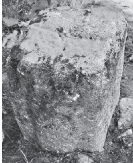
FIG. 4.1. Cippo 1-Felgueira (2004).

La zona centuriata corrisponde ad una vasta area che include un territorio con altitudini poco elevate e suoli dal considerevole potenziale agricolo, tagliati dalle vie romane che uscivano da Braga. La centuriazione si prolunga, inoltre, in un'area a bassa quota lungo il margine destro del fiume Cá-