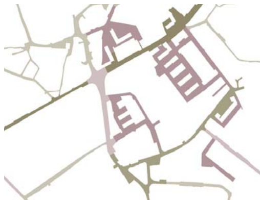
Fig1: As espacialidades do espaço viário na freguesia de Mozelos - Santa Maria da Feira, 2011.

No âmbito desta investigação iniciou-se a representação das espacialidades da via. Desde muito cedo a diversidade e desarticulação entre os mais diversos elementos exigiu a definição de um conjunto de parâmetros que ao orientarem para elementos específicos que integram o sistema de espaços os viabilizaram. Foi essa operação que criou condições para que, perante as mais diversas circunstâncias, fosse possível encontrar um código de leitura que arrumasse e realçasse as características comuns. O resultado é um conjunto de desenhos que não integra as reflexões ou instrumentos urbanísticos mais comuns e que decorre de um modo particular de olhar.