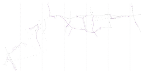
Fig3 As redes de abastecimento eléctrico, iluminação pública e telecomunicações em Nogueira da Regedoura – Santa Maria da Feira 02/2012

O segundo desenho delimita os usos que têm autonomia espacial e diferencia com cores os diferentes revestimentos de solo. O desenho permite-nos afirmar que o processo de estabilização do perfil está longe de se concluir, são várias as intervenções, muitas delas recentes, que o colocam em causa; a espacialização dos diferentes usos acontece de forma súbita e por vezes surpreendente, dispondo-se no território de forma casuística e fragmentada; a representação dos materiais de solo evidencia que, neste território, não existe um material exclusivo de um determinado uso (requisito quase sempre imposto pelas lógicas da mobilidade); a largura do canal, elemento importante para o conforto e segurança rodoviário, está longe de estar estabilizado. Aparentemente, as variações de medida que ocorrem na via não são determinantes da sua eficácia.