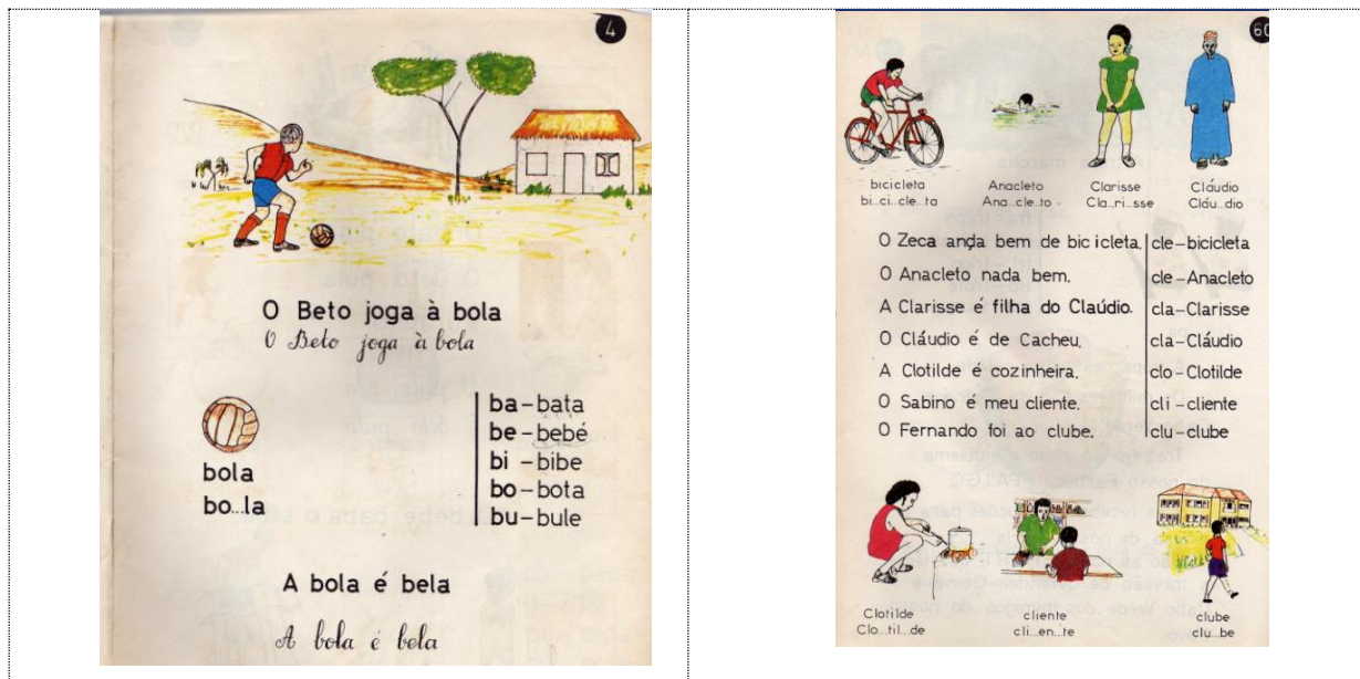
Fig.1: Páginas do 1º manual de iniciação à leitura de Cabo Verde independente

Do ponto de vista sociocultural vê-se claramente a preocupação em fazer constar ícones e símbolos ligados à consciência nacionalista, com símbolos nacionais, história da luta armada, desenhos de casas e motivos da realidade local, e até um indivíduo trajado de bubú 7 .