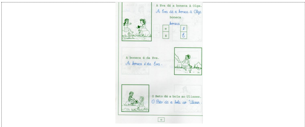
Fig. 17: Páginas do manual de iniciação à leitura em Cabo Verde. Período de 1994 a 2012.

No manual da segunda República nota-se ausência total dos símbolos nacionais, apelos ao patriotismo e nacionalismo característicos dos manuais da primeira república. Os elementos socioculturais são, aparentemente, mais neutros. As imagens não são coloridas (eventualmente por razões económicas). O manual não traz nem textos, nem palavras, nem frases na LCV.