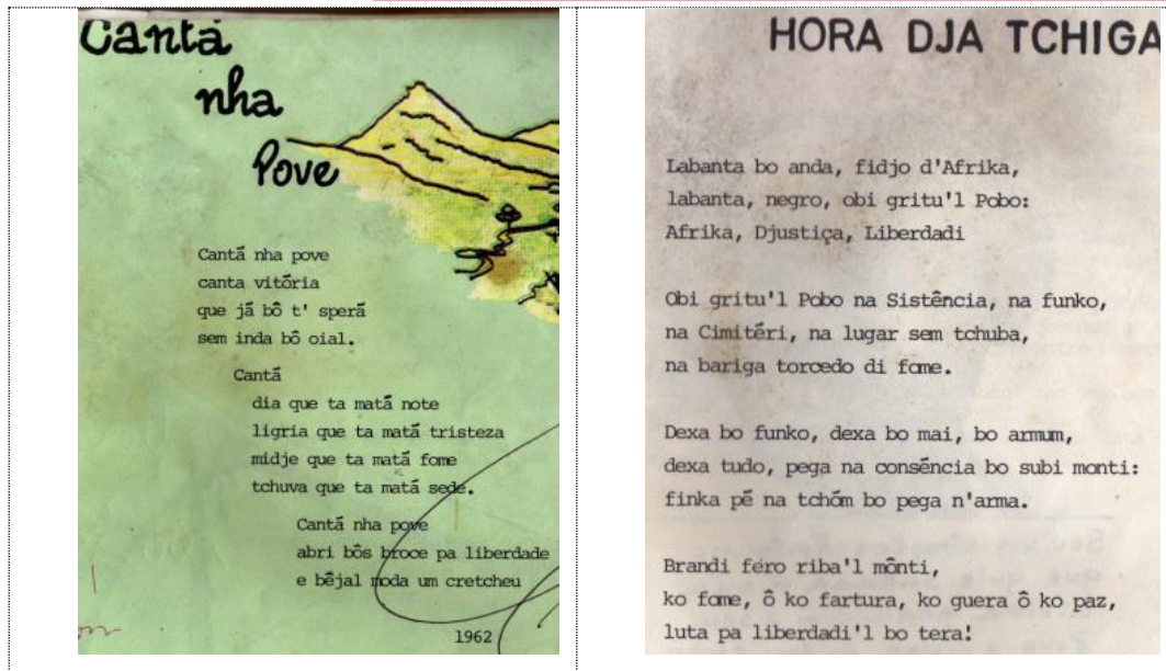
Fig.18: Texto em LCV em manuais da primeira República.