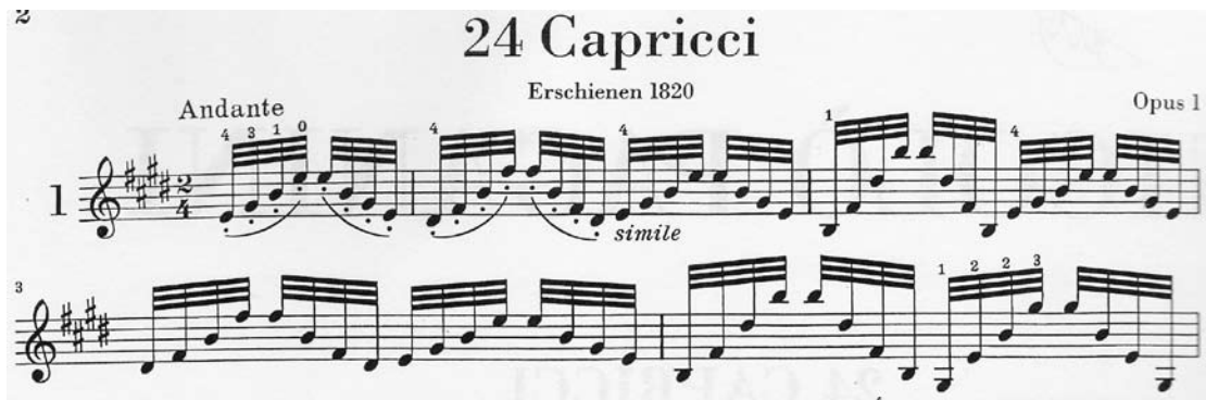
Ejemplo 4. Fragmento del Capriccio nº 1, Nicolò Paganini, Milán, 1820

realización mecánica de este recurso es una posibilidad connatural a la mayor parte de instrumentos de cuerda; por lo tanto, podemos concluir que la mencionada atribución es un tanto osada.