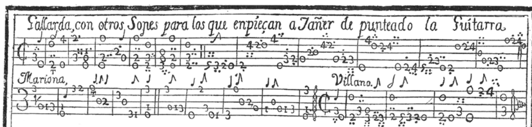
Ejemplo 7. Gaspar Sanz: Instrucción de música sobre la guitarra española. Zaragoza, 1674 26

He visto y oído en algunos una improba ejecución en ambas manos, pero mal ordenada; (bien que tocar bien, ó tocar mal, todo es tocar.) A otros, y de éstos muy pocos, solo tocar innumerables carreras ligadas de fusas y semifusas, sin variar, como si la Guitarra no tuviera el mismo privilegio que los demás instrumentos, debiendo verificarse oportunamente ya los puntos ligados, ya los picados, ya variando de arpeggios, duos, y otros primores del arte... 24