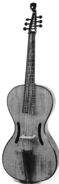
Figura 4. Arpeggione atribuido a Anton Mitteis. Viena, ca. 1825. Salzburg Museum 33

La siguiente imagen es una fotografía de un arpeggione que se conserva en el Salzburg Museum . El instrumento fue construido en el primer cuarto del siglo XIX, y se atribuye a Anton Mitteis, discípulo de Stauffer.