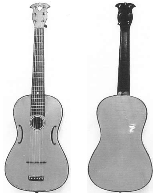
Figura 2. Guitarra Mauchant Frères, Mirecourt. Gemeentemuseum, La Haya 30

Hay en la tapa de este instrumento dos agujeros laterales en forma de “ce” que recuerdan las “efes” de la familia del violín, y un segundo puente que sirve de apoyo a las cuerdas, todo lo cual revela el mencionado contagio en la forma y la construcción. Una guitarra similar puede verse en el Gemeentemuseum de la Haya, en perfecto estado de conservación.