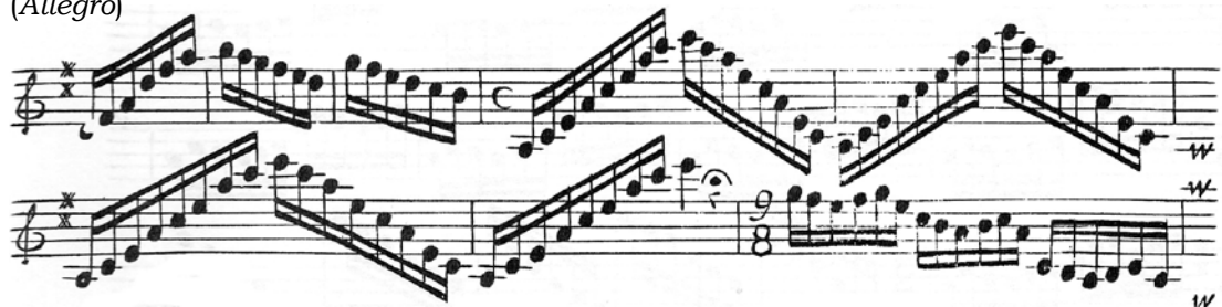
Ejemplo 6. Fragmento del Capriccio nº 24 para violín. Concerto IV, Pietro Antonio Locatelli, Amsterdam, 1733

El modelo de arpeggio o acorde desplegado usado por el músico brasileño es más similar a los utilizados en los instrumentos de