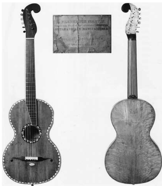
Figura 3. Guitarra de Christian Frederick Martin, ca 1833 32

En otras guitarras de la época también podemos encontrar detalles de construcción tales como cabezas inspiradas en la silueta de las cabezas de los instrumentos de cuerda frotada; este tipo de cabeza es muy frecuente en la lutería guitarrística de la época; entre los lutieres que las utilizaron figuran Genaro Fabricatore, Johann Georg Stauffer, y Christian Frederick Martin, que fue alumno de Stauffer. 31