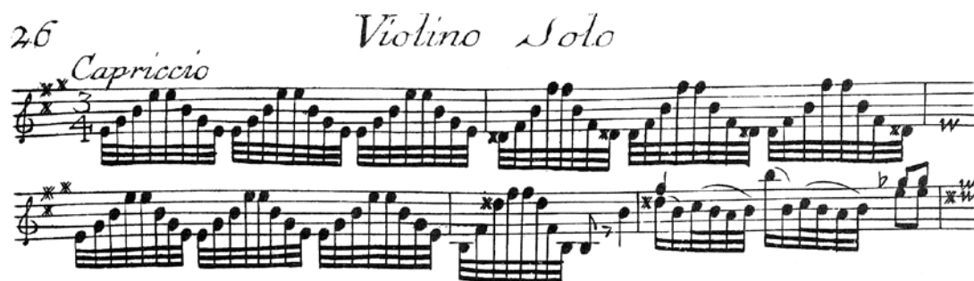
Ejemplo 3. Fragmento del Capriccio n° 7 de Pietro Antonio Locatelli. Concerto IV , Amsterdam, 1733

La experiencia de Paganini con instrumentos de cuerda y trastes podría explicar, hasta cierto punto, su predilección por el virtuosismo cromático y el uso frecuente de ligados de mano izquierda ( pizzicatti ) en el violín, llamados ligados técnicos o instrumentales por los guitarristas. En efecto, el pizzicatto de mano izquierda fue muy usado por Paganini, y según una creencia común se trataba de un recurso trasplantado de la técnica guitarrística. Sin embargo, no deberíamos olvidar que la