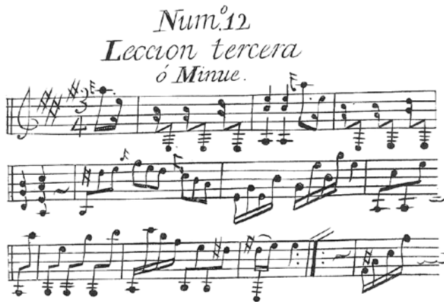
Ejemplo 8. Lección tercera, Fernando Ferandiere. Escritura violinística en la guitarra. Madrid, 1799

ñala Dell'Ara, 27 por lo que resultó natural el traslado de escritura propio de un instrumento fundamentalmente melódico que indica las diferentes voces sin precisar su duración real, la cual aparece sólo sugerida en la partitura, como puede verse en las obras de Doisy y de otros contemporáneos de estilo similar, como el violinista y guitarrista español Fernando Ferandiere. 28