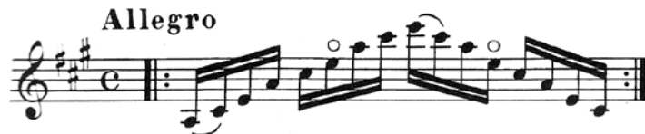
Ejemplo 5. Fragmento del Estudio nº 2 para guitarra, Heitor Villa-Lobos, París, 1929