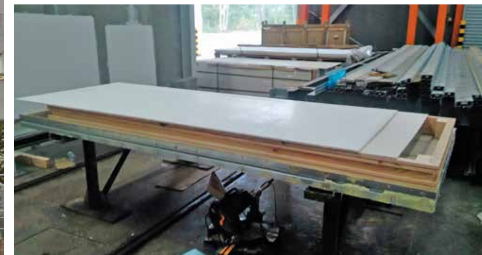
Construção de protótipo do painel modular.