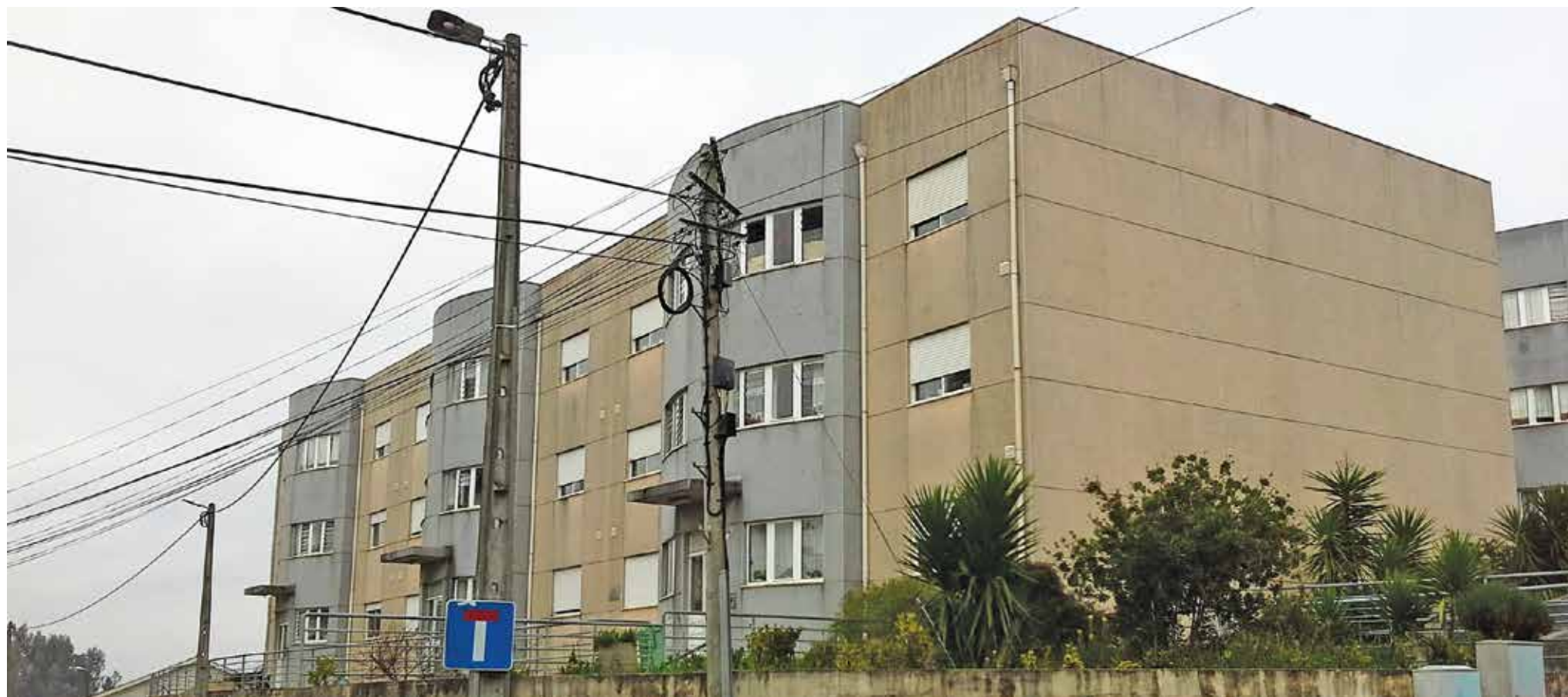
Edifício piloto (gerido pela Gaiurb) (fonte: Electrofer).