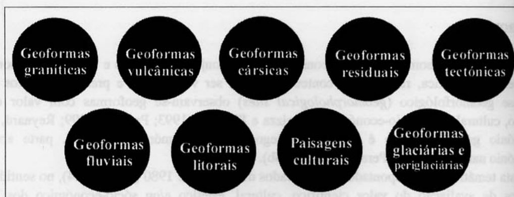
Fig. 2 -- Categorias temáticas do património geomorfológico português.

No seguimento da estratégia da definição de frameworks para a inventariação do património geológico e geomorfológico observada a nível internacional, propõe-se a inventariação do património geomorfológico português de acordo com nove categorias temáticas ( frameworks ) (Fig. 2) (Pereira et al. 2004a).