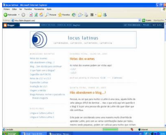
Figura 2 - Blogue Locus Latinus

Neste blogue participaram 35 alunos de dois anos diferentes, 1º e 2º, inscritos num regime de avaliação progressiva, com o objectivo de criar um sentido de comunidade em volta do assunto desenvolvido, o Latim. O blogue funcionava ainda como porta de entrada para dois websites convencionais, de cada uma das disciplinas.