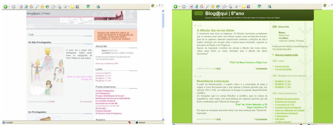
Figura 4 - Os blogues dos alunos do 2º e 3º ciclos

Numa primeira fase, os alunos tomaram contacto com esta ferramenta apercebendo-se da facilidade de edição on-line. Os alunos começaram por ser confrontados com um desafio lançado no blogue que tinham de solucionar. Em cada desafio, os alunos tiveram que desenvolver várias competências, nomeadamente, competências básicas como analisar, sintetizar e saber ler diferentes fontes históricas para produzir o seu comentário.