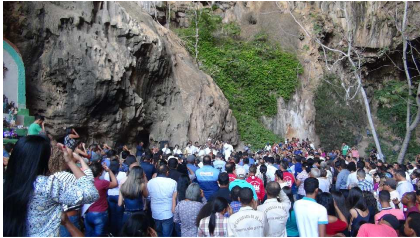
Figura 5 – Celebração Religiosa no Interior da Caverna próxima ao altar. Agosto de 2016.

A romaria é a principal festa da região, ocorre desde os anos 1930 e recebe pessoas de diversos municípios próximos, como Guarani de Goiás, Posse e Iaciara, que se deslocam a pé, a cavalo e de carro para cumprirem suas promessas.