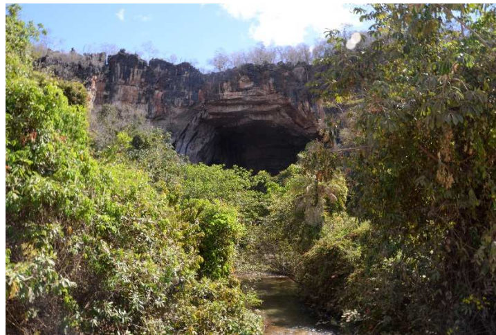
Figura 7. Boca da caverna Terra Ronca e perspectiva da mata galeria. Fotografia: Vinícius Galvão Zanatto, Setembro 2017.

A parte posterior da caverna Terra Ronca está mais bem preservada que sua entrada. Existe uma grande presença de estalactites e uma maior variedade de formações. A mata de galeria desta área também está mais preservada (Figura 7). O pisoteio do solo ocorre somente na trilha em que a visita acontece.