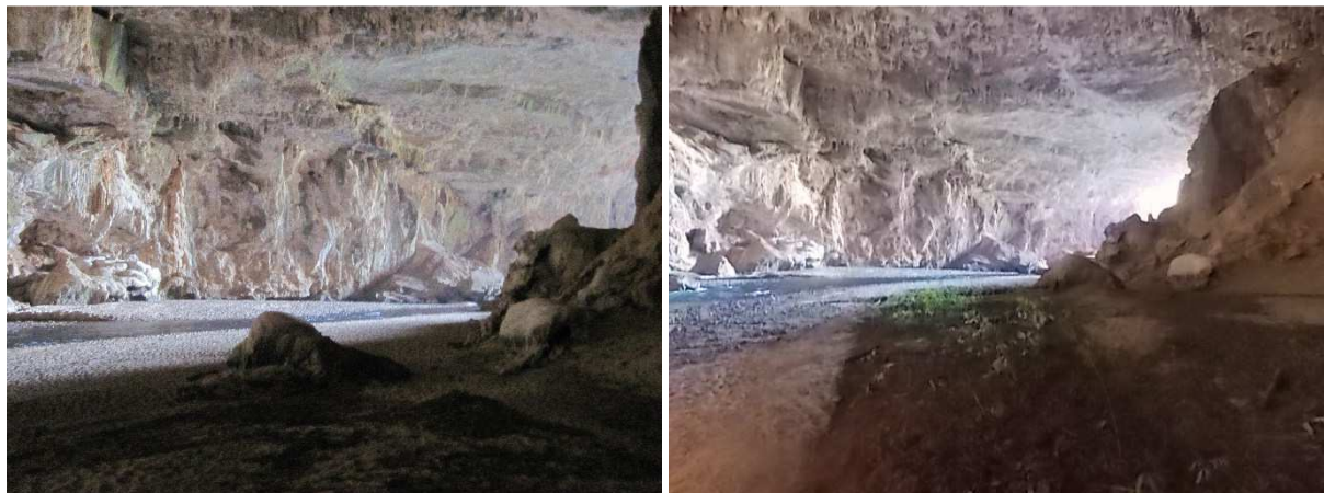
Figuras 3 e 4 - Mudanças na quantidade de matéria orgânica dentro da caverna. Setembro 2012 e Julho 2016.

O ambiente da caverna é bastante dinâmico, tendo alterações de acordo com as variações no regime hídrico. Durante o período chuvoso são carregadas grandes quantidades de materiais orgânicos originários das matas próximas, como terra, sementes e galhos. Quando o período de chuvas termina a altura das águas dos rios diminui, possibilitando a acumulação desses materiais em alguns locais, mas não necessariamente nos mesmos lugares todos os anos. A partir das fotografias a seguir, pode-se observar esta dinâmica. A primeira foto foi tirada durante o mês de setembro de 2012, nela se podendo observar a presença de um banco de areia (Figura 3), enquanto na fotografia seguinte, tirada no mês de julho de 2016, se nota a presença de matéria orgânica no lugar do banco de areia, com diversas plantas germinando (Figura 4).