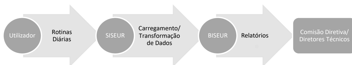
Figura 2 - Integração do BISEUR no SISEUR

O PO SEUR tem implementado um Sistema de Informação (SISEUR) que tem como objetivo a gestão de informação referente a projetos candidatos e aprovados a financiamento através do PO SEUR. O sistema corre em ambiente Web através do browser e permite a realização de operações de introdução, alteração, remoção e pesquisa. A integração do BISEUR com o SISEUR será da seguinte forma: