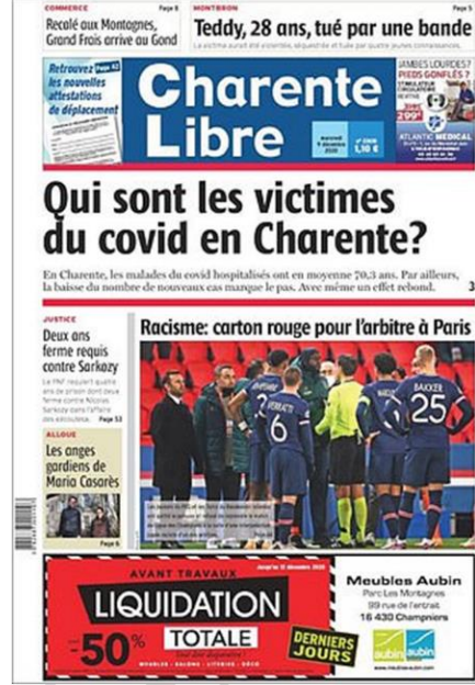
Figura 5 – Caso Webó: primeiras páginas de jornais turcos e um francês. Edição de 9 de dezembro de 2020