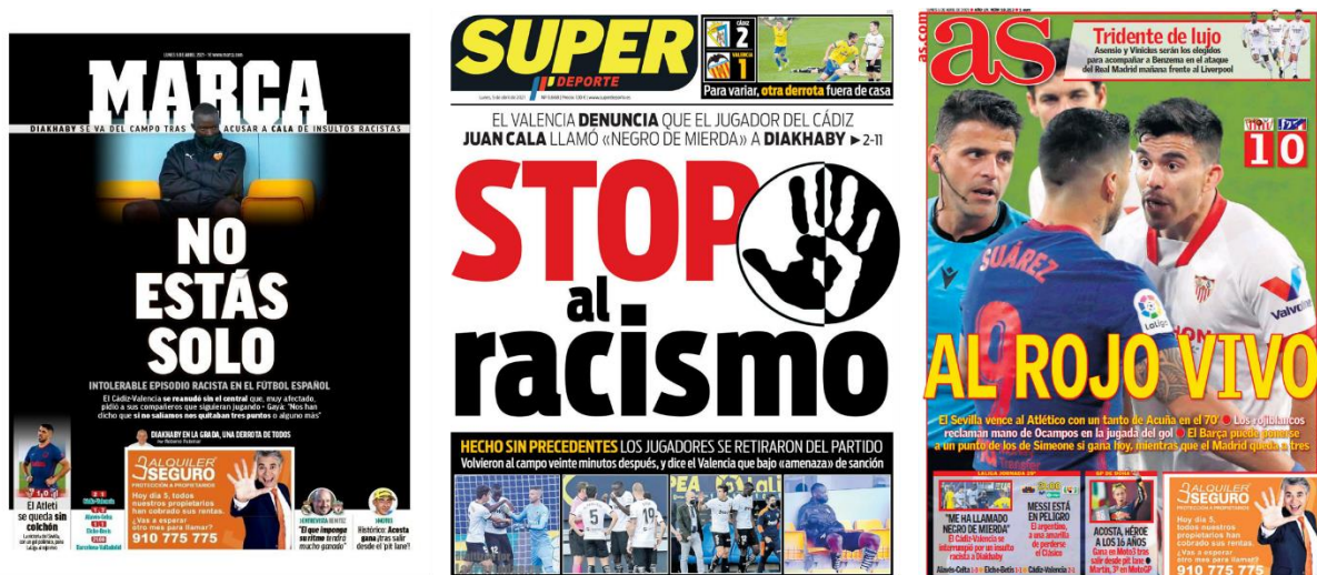
Figura 9 – Caso Diakhaby: primeiras páginas de alguns jornais desportivos em Espanha. Edição de 5 de abril de 2021

A partir do caso apresentado, a Tabela 3 procura sistematizar as informações sobre a análise formal: