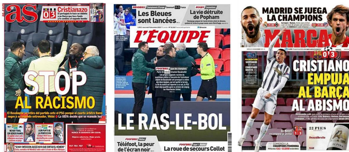
Figura 7 – Caso Webó: primeiras páginas de dois jornais desportivos espanhóis e um francês. Edição de 9 de dezembro de 2020

A dimensão internacional da competição justifica a inclusão de mais elementos a esta amostra. Até por isso se percebe a mediatização de uma competição relevante no futebol europeu, como a Liga dos Campeões.