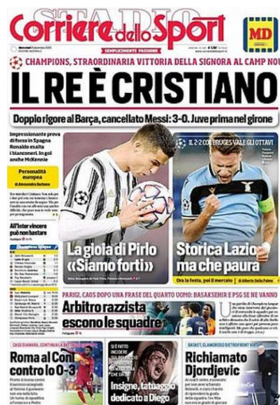
Figura 6 – Caso Webó: primeiras páginas de jornais desportivos italianos. Edição de 9 de dezembro de 2020