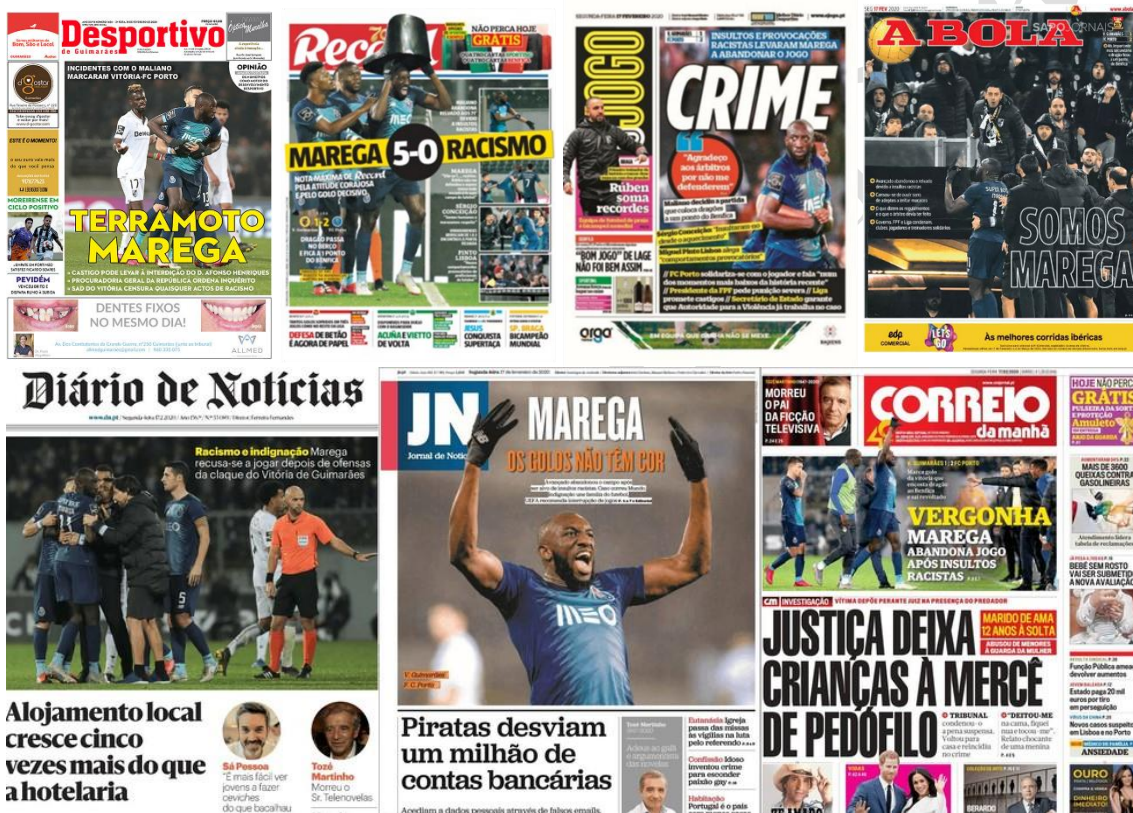
Figura 4 – Caso Marega: primeiras páginas de jornais generalistas. Edição de 17 de fevereiro de 2020

Antes de partirmos para a análise, exibimos de seguida as capas que estiveram na base do primeiro caso (Figuras 4 e 5).