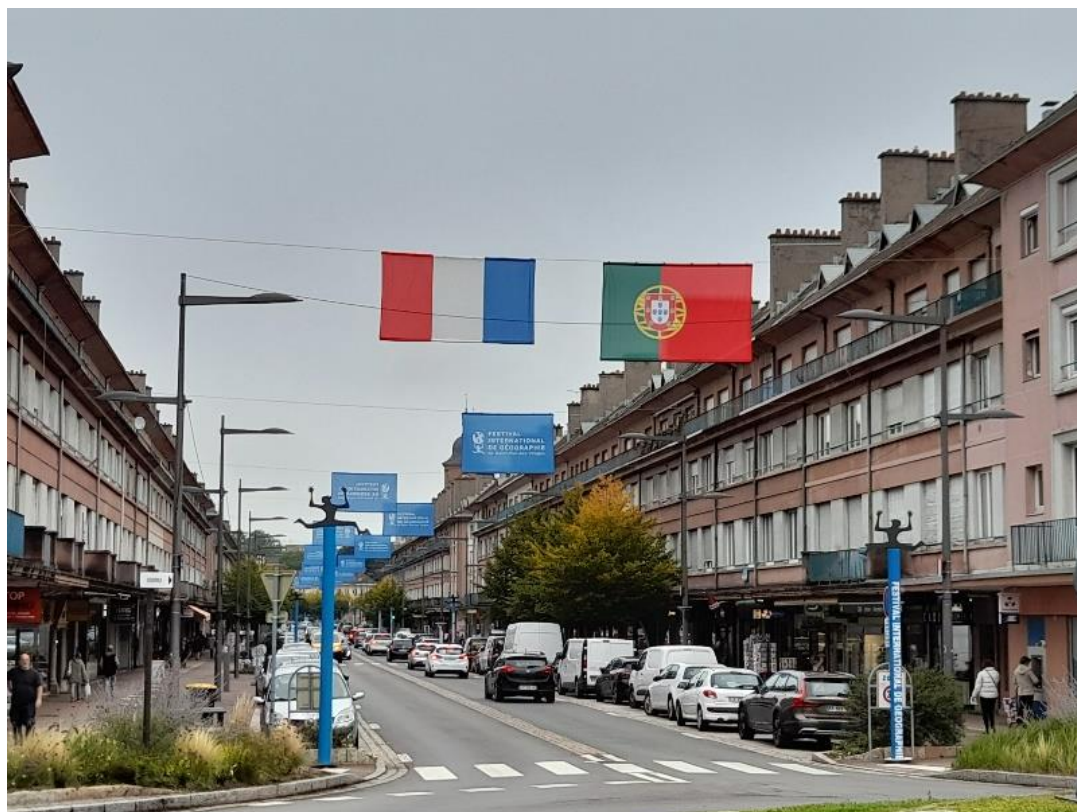
Fotografia 1: Saint-Dié-des-Vosges

O Festival, muito acarinhado e com uma forte presença de emigrantes portugueses em França, contou com a participação da comunidade geográfica portuguesa, tendo estado representadas todas as universidades (Minho, Porto, Coimbra, Lisboa (2) e Évora) onde se lecionam cursos de Geografia, bem como geógrafos de quase todo o país, ligados às mais diversas instituições públicas e privadas existentes em Portugal.