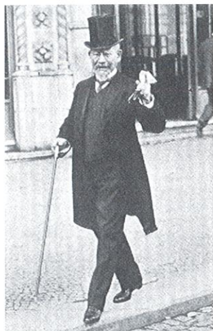
O Dr. Rodrigues Alves passeando informalmente em Lisboa, por ocasião da sua visita particular a Portugal, em 1908. Fotografia de J. Benoliel, publicada na Ilustração Portuguesa , nº 143, de 16 de Novembro de 1908