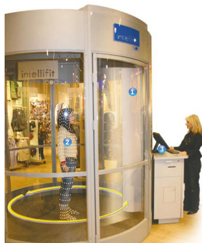
Fig 2: Cabine desenvolvida pela Intellifit que funciona como body scanner 3D.

Através de ondas de rádio o aparelho pode medir o corpo vestido em qualquer tipo de tecido. Além de medir, sugere diferentes modelos no tamanho ideal do consumidor.