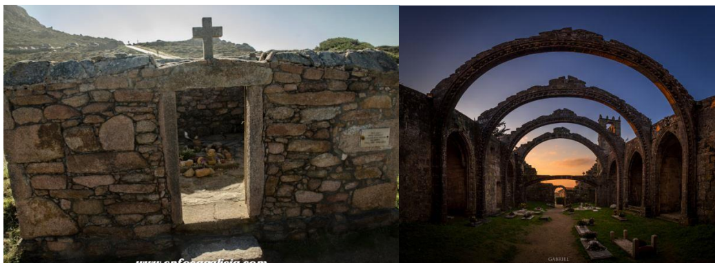
Figura 6- Cemitério dos Ingleses (Foto 11) e o Cemitério de Santa Mariña-Camariñas (Foto 12)