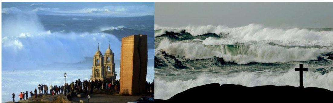
Figura 3- Temporais, ondas gigantes em Muxia e Camariñas (Fotos 5 e 6).