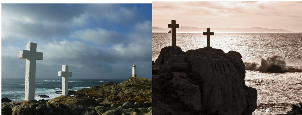
Figura 7 – Cruzes memoriais em Punta Roncudo (Fotos 13 e 14)