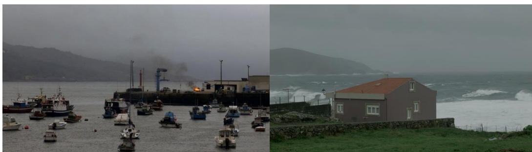
Figura 9- Paisagem distópica dos filmes “Costa da Morte (Foto 17) e “Penúmbria” (Foto 18)