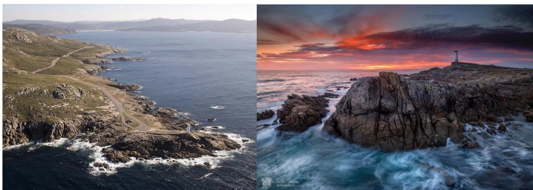
Figura 1- Farol de Punta Runcudo (Fotos 1 e 2).