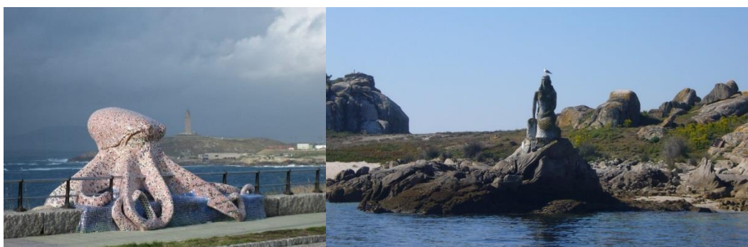
Figura 8 – Monstros marinhos: ex: Polvo - Corunha (Fotos 15) e Sereia- Ilha Salvora (Foto 16).