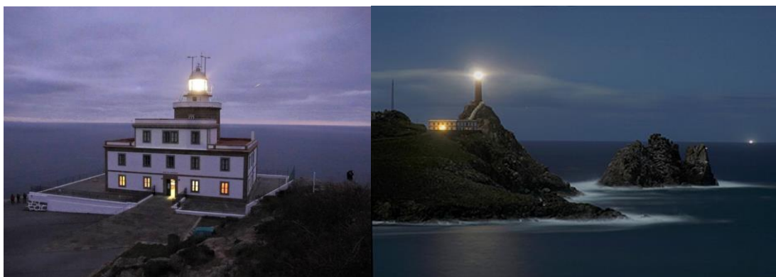
Figura 2- Farol de Cabo Vilan (Fotos 3 e 4).