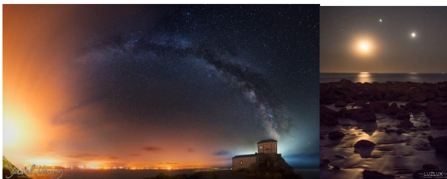
Figura – 10- Fenómenos celestes: Via Lactea (Foto 19) e alinhamento de planetas (Foto 20).