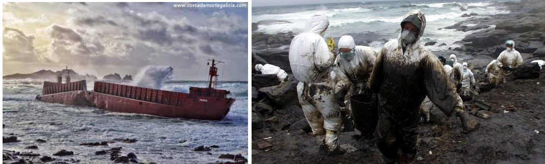
Figura 4- Naufrágios: O Prima encalhado na praia de Riera (Foto 7) e o desastre do petroleiro Prestige (Foto 8).