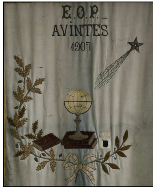
Figura 3 - Estandarte.

Fonte: Pormenor do estandarte da escola do Palheirinho, foto de Fernando Liberdade, 2008 (cortesia de José Vaz).