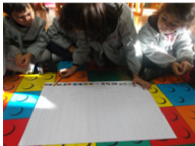
Fig.1- Escolha das obras e construção de gráfico

única, a matemática. O gráfico da atividade foi organizado numa cartolina, as imagens das capas dos livros de histórias foram coladas no sentido horizontal e os numerais cardinais no sentido vertical (Cf. Fig. 1). As crianças votaram nas histórias de que mais gostavam e foi-se construindo o gráfico.