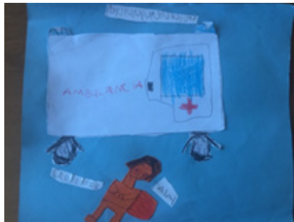
Fig.2- Cut out- representação do acidente de Frida Kahlo