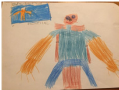
Fig.6- desenho-representação do internamento do D. no hospital