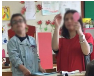
Fig. 4- Jogo simbólico- momento de representação e comunicação sobre o ofício de Frida Kahlo.

Para comunicar ao grupo a obra que escolheu através da sua recriação, pediu à convidada que vestisse um pano vermelho e fizesse de conta que era a Frida, segurando um pincel e um espelho para fazer de conta que pintava o seu autorretrato, destacando esta como a característica que achou ser mais relevante (Fig. 4).